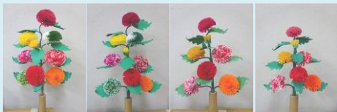
9ツ花(大) 2,900円 9ツ花 2,400円 7ツ花 1,900円 ミニ花 1,700円

会員の方々が、毎日、毎日、コツコツと丹精込めて作る繊細な彼岸花は、芸術品ともいえるもので、例年、新聞やテレビでも紹介されて注目されております。事務所で販売しておりますが、手作業のため製作できる数も限られていますので、お早めにお求めください。