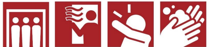
密閉回避 換気 咳エチケット 手洗い