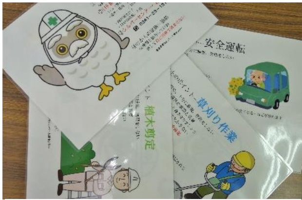
事故防止に向けて、運転、草刈、剪定の作業時の注意点を記した点検カード

今年度に入り、就業中の事故は既に6件発生しており、自動車(バイク)の運転中のものが4件を占めています。車の事故は、一歩間違えば大事故につながりかねません。自分を過信せず、同乗者がいる場合は、バックする際に誘導をしてもらうなど細心の注意をお願いします。