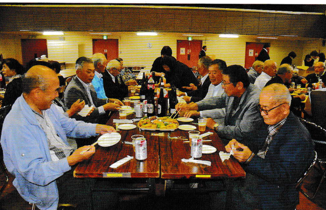
総会終了後の懇親会が復活し、楽しく語り合いました。