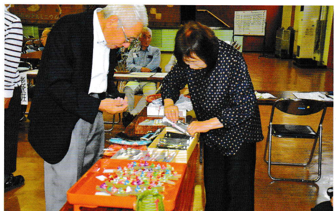
あねさま倶楽部が総会前に、自分たちが作ったものを陳列しました。