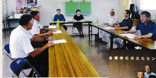
安全・適正就業 委員会