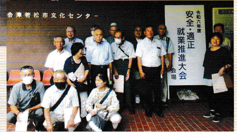
安全・適正就業 推進大会