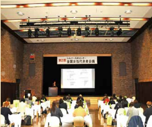
シルバー人材センターの現状と今後についてと全国女性代表会議の講演。

進行する高齢社会の中でシルバー人材センターが男女共同参画をどう実現していったらよいのか共通の問題意識をかかえ立場を同じくする女性たちが一堂に会し意見交換などを行うことが出来る場を創りたいと考えて「シルバー人材センター全国女性代表会議」を立ち上げました。今年度の開催は福島県喜多方市での開催となりました。