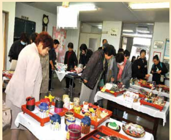
2日目は「あねさま倶楽部」「アイデミきたかた」の視察。あねさま倶楽部では小物やエプロン、帽子などを製作しております。