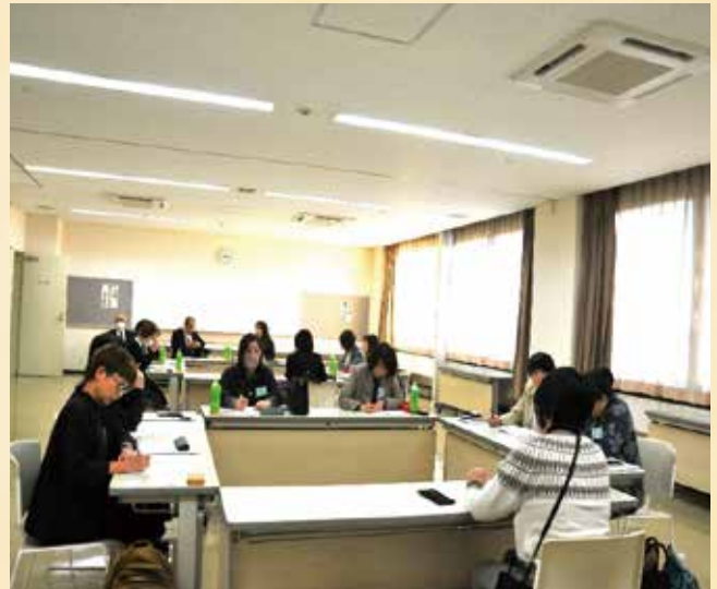
理事長、事務局長それぞれの立場で意見交換がなされました。