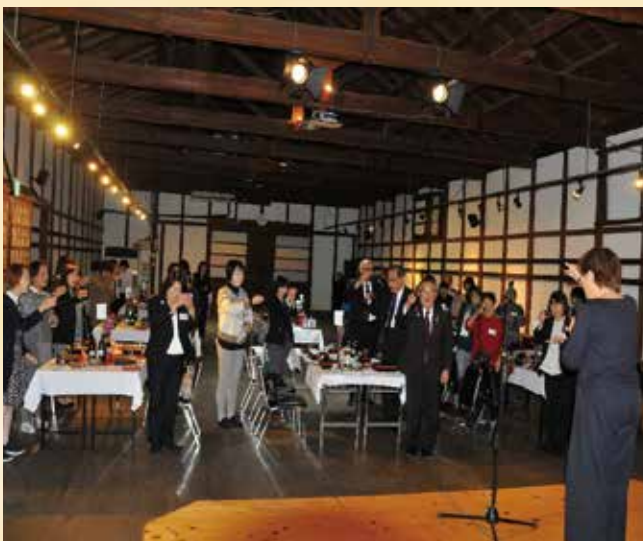
会議終了後の、大和川酒造昭和蔵で交流会となり他シルバー人材センターとテーブル囲んで楽しく過ごしました。